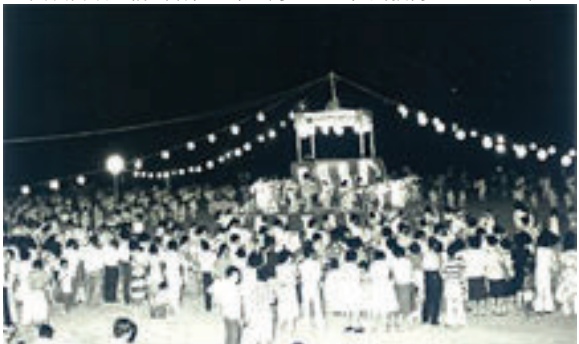
▼西淡音頭の輪(昭和51年7月31日・社会教育グラウンド)

に名誉町民の称号を贈呈した。それと同時に西淡町はふるさとソング「西淡音頭」を作成した。