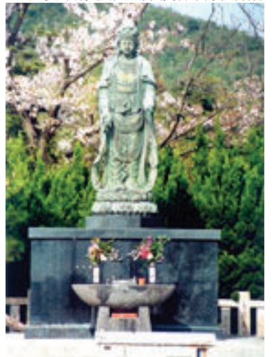
▼慈母観音像(文化勲章受賞者・富永直樹作)

阿那賀に設置した。平成五年には海釣り公園が、平成十二年には伊弉うずしお村がオープンした。