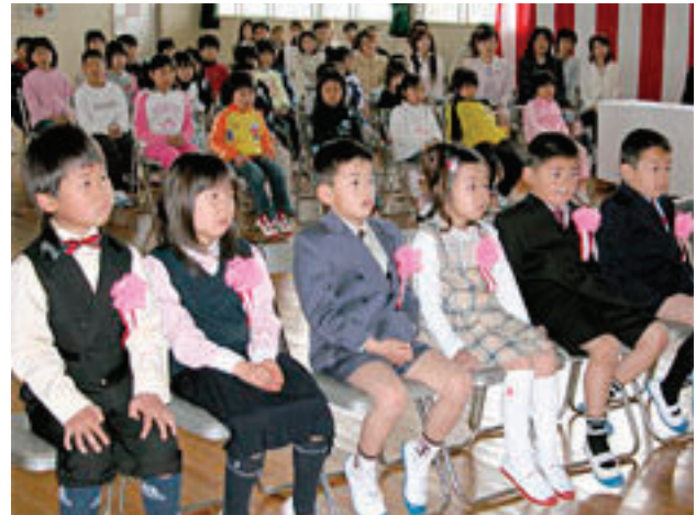
▲志知小学校の入学式

松帆保育園の入園式が4月5日に、小中学校の入学式が4月8日に、幼稚園の入園式が4月9日に行われ、新入生らは在校生から温かく迎えられました。